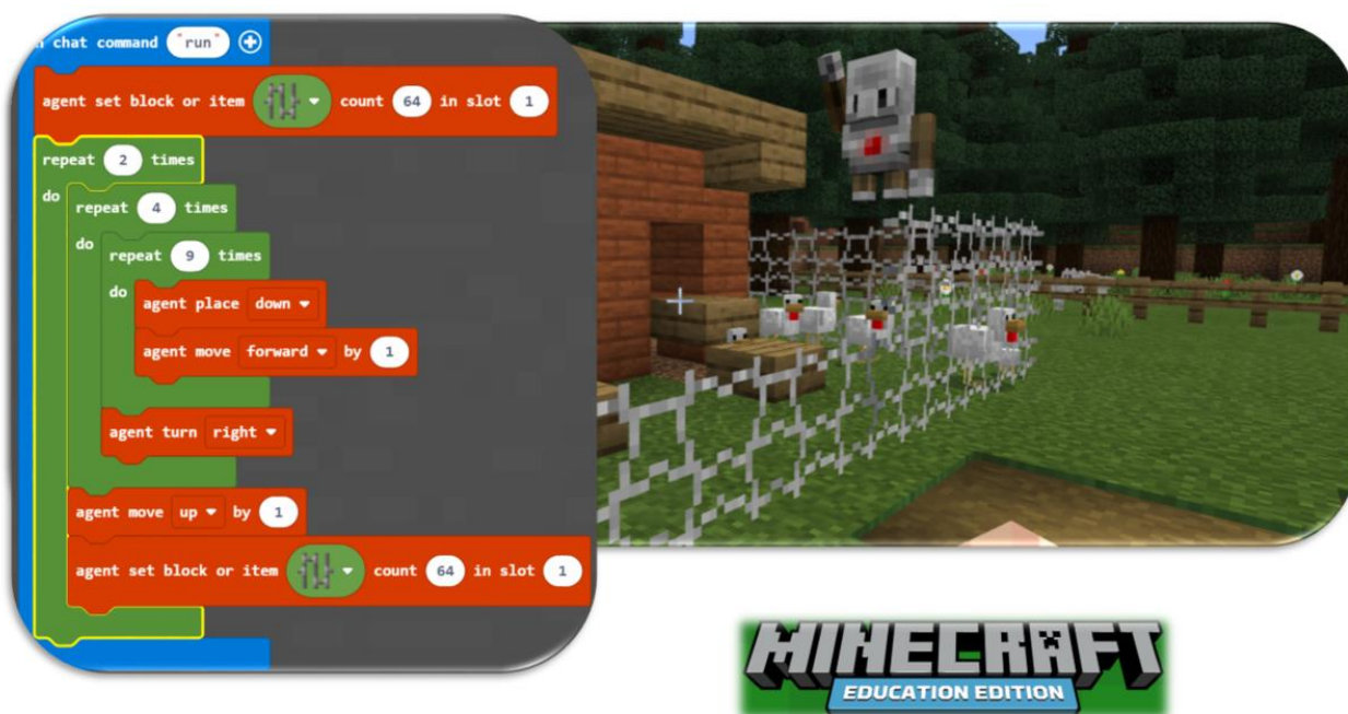
Slika 1: Agent zgradi ograjo in obvaruje ovce pred volkom.